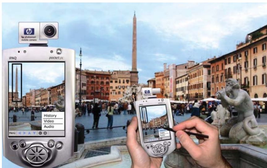
Slika 1: Prototip na vidu temelječe mobilne storitve: sposobnost dojemanja turista opremljenega z dlančnikom se poveča, če videnim predmetom (npr. znamenitostim) dopolnimo pomen z dodatnimi informacijami.

Podobno kot pri človeku bo tudi pri mobilnih sistemih, ki jih gradimo v okviru projekta MOBVIS, poglavitni vir informacij o uporabnikovi okolici vizualna informacija. Na podlagi vizualne informacije je možno ugotoviti ne samo to, kje se uporabnik nahaja, to je njegov geografski položaj, ampak tudi kaj je v njegovi okolici in posledično v kakšnem kontekstu se trenutno nahaja. To bo omogočilo gradnjo mobilnih aplikacij, ki so sedaj le stežka uresničljive, saj zahtevajo veliko informacij o uporabnikovem okolju, ki jih lahko trenutno zagotovi le uporabnik sam, preko omejenega uporabniškega vmesnika mobilnih naprav. Predstavljamo si mobilni telefon, ki avtomatično poveča glasnost zvonjenja, ko ugotovi, da je uporabnik na ulici polni ljudi in ga avtomatično utiša na koncertu klasične glasbe ali sestanku. Predstavljamo si turista, ki ga mobilna naprava vodi po zanimivem mestu, kot je prikazano na Sliki 1. Predstavljamo si spletni dnevnik, ki avtomatično beleži pomembne stvari iz življenja svojega lastnika. Vse te in še mnogo drugih aplikacij je možno razviti, v kolikor ne samo zajamemo sliko uporabnikove okolice, ampak tudi razumemo kaj se na sliki nahaja in dogaja.